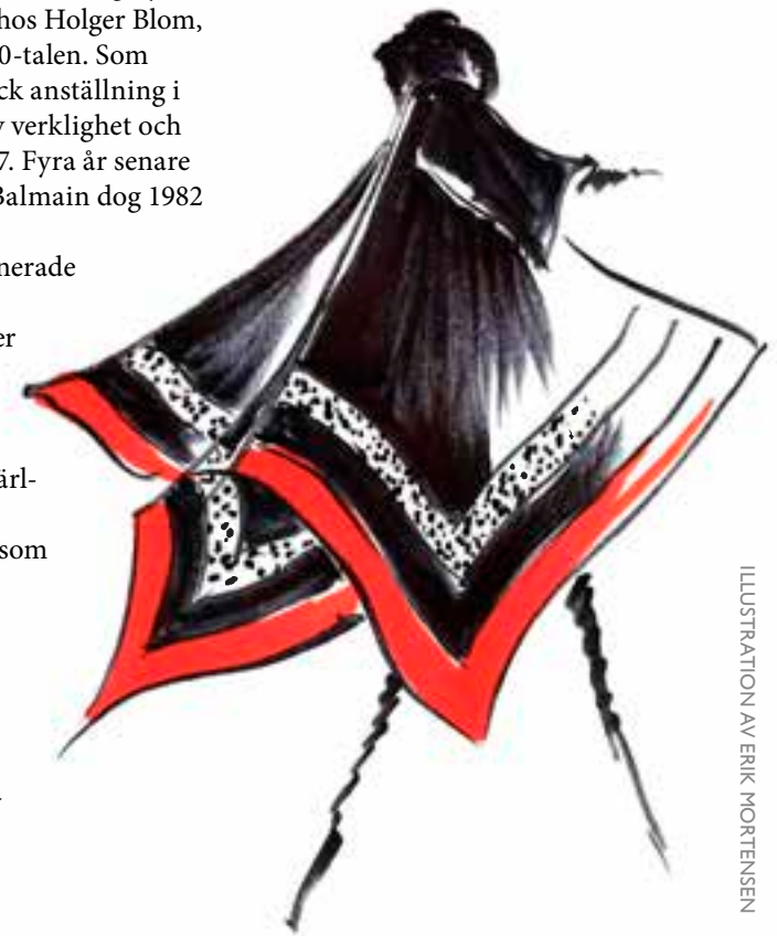
ILLUSTRATION AV ERIK MORTENSEN

Utställningen är uppbyggd i olika teman som ger en unik insikt i Erik Mortensens unika talang för design, arvet från Balmain, hans skapandeprocess, hans kärlek för olika material och hans sublima hantverks- skicklighet. Det finns flera exempel på Mortensens modeshower och berättelser om hans privata kunder, där ibland celebri- teter och kungligheter. ■