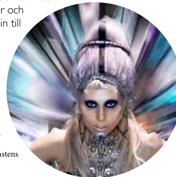
LADY GAGA, BORN THIS WAY, 2011. STILL.