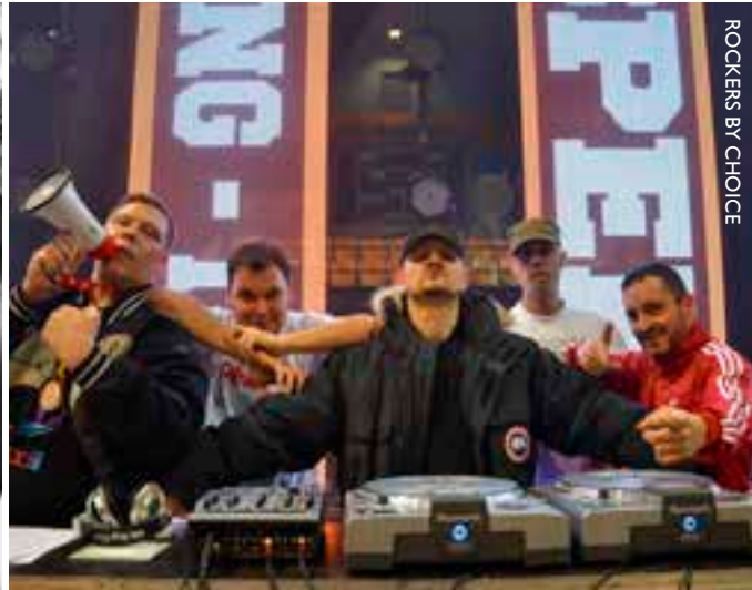
ROCKERS BY CHOICE