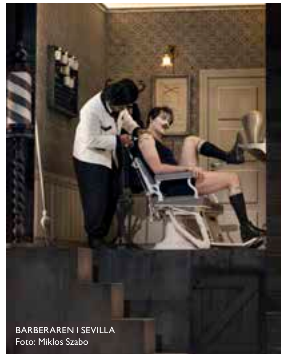
BARBERAREN I SEVILLA

"Svansjön" har blivit kallad världens mest berörande balett och när Den Kongelige Ballet framför verket uppstår ren magi. Svanen är ett av de mest eleganta djur som finns och det var ett genidrag i slutet på 1800-talet när man lät balett-