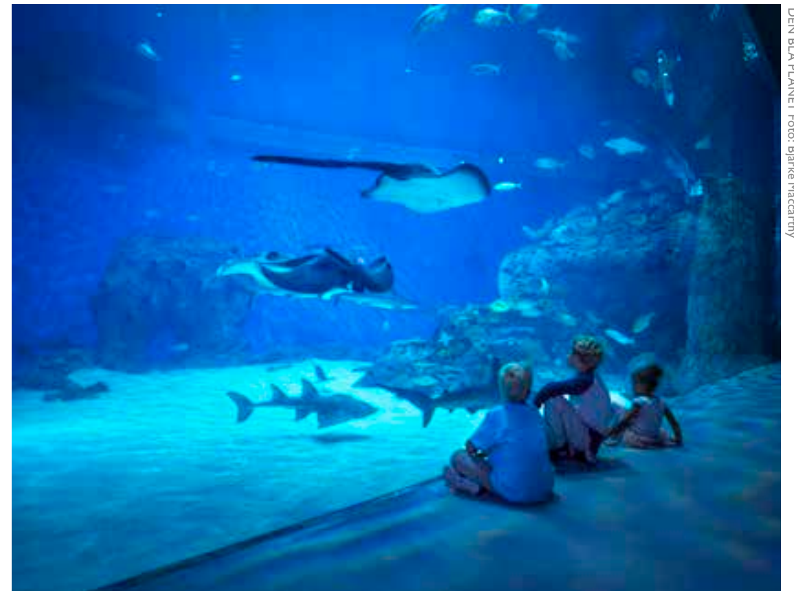
DEN BLÅ PLANET